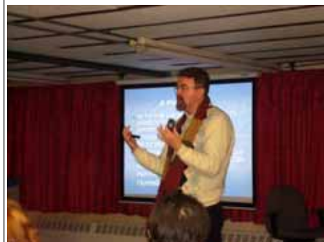
Todos falaram: uma palestra inesquecível.

O orvalho num lírio alvo é diamante celeste, Néio Lúcio no livro Jesus no Lar mas, na poeira da estrada, é gota lamacenta. Mensagem Explicações do Mestre Não te esqueças desta verdade simples e clara da Natureza. Psicografia de Chico Xavier