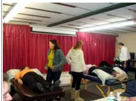
A parte prática do Seminário de Passes