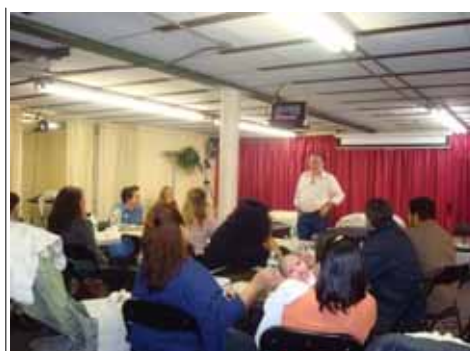
Platéia atenta ao Seminário de Passes

de aniversário do Cantinho da Informação de Luz , em março e abril próximos. Garantimos que vocês não vão perder por esperar por apenas dois meses.