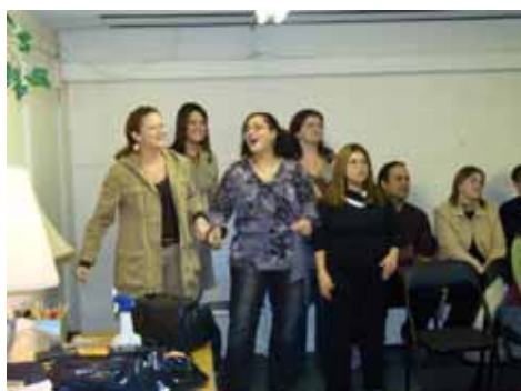
Como elas mesmas se denominam, as Jacobetes