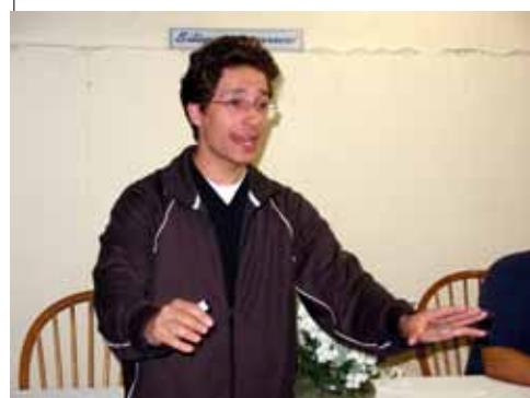
Nahur - 30 de Abril - "150 anos de Espiritismo. O que fazer para os próximos 150 anos?"

Obrigado a Deus e à Diretoria da casa pelo imenso e inefável amor doado e exemplificado nesse mês.