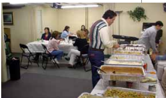
Se você não foi, não sabe o que perdeu. Venha ao próximo.