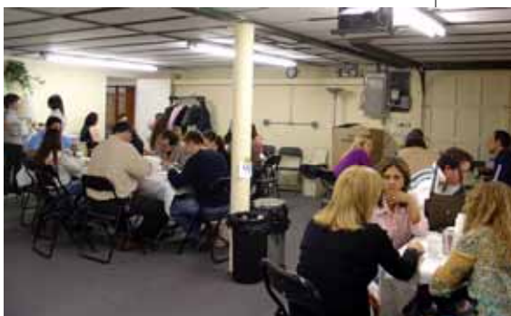
Diversos Grupos Espíritas vieram nos prestigiar. Obrigado.

O Almoço Fraternal realizado no dia 1º de abril foi um sucesso total. Tivemos a participação de mais de 70 pessoas que vieram se comprazer com os pratos deliciosos preparados pelas nossas incansáveis trabalhadoras. Vejam aqui algumas fotos desse momento ímpar de confraternização.