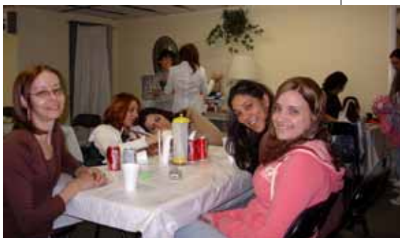
Lindos sorrisos, cheios de satisfação!

No mesmo mês de abril, tivemos também a programação especial