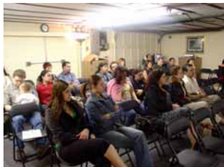
Assistência - 21 de Abril

No dia 18 de abril, fomos à casa de uma companheira de ideal para podermos assistir a uma palestra