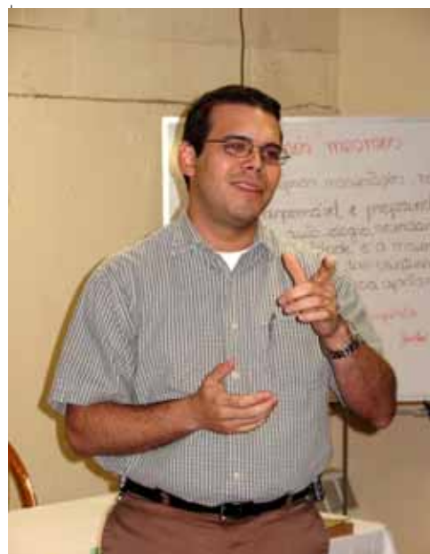
Thomas - 23 de Abril - "Espiritismo e o Indivíduo"