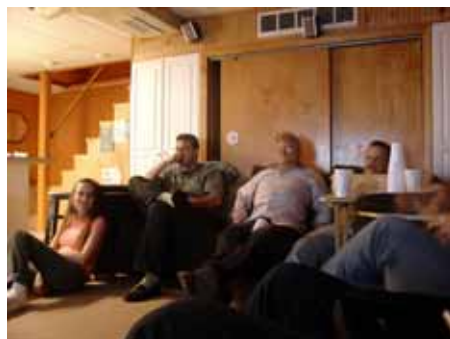
18 de Abril de 2007 - 150 anos de Espiritismo

de Divaldo Franco, ao vivo, pela internet. Realizada no dia do aniversário do Espiritismo, a palestra foi emocionante e cheia de luz passada através das palavras sempre sábias do orador baiano.